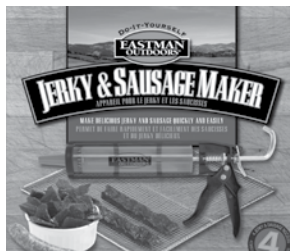
Ensemble pour la fabrication du jerky et des saucisses