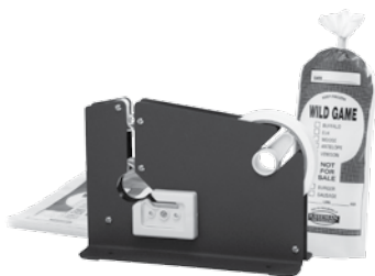
Ensemble de sac pour la congélation/dévidoir de ruban et ensemble de recharge