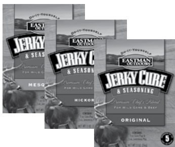
Sachets d'assaisonnements pour le jerky et la saucisse

Pour commander un des accessoires Eastman Outdoors MD illustrés ci-dessus, visitez le détaillant Eastman Outdoors MD le plus près de chez vous ou communiquez avec le service à la clientèle Eastman Outdoors en composant le 1-800-241-4833. Nous serons heureux de vous aider si vous avez des questions ou désirez placer une commande.